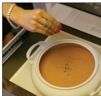
Un intérieur de dimensions généreuses 17" x 16", parfait pour les plats de service, les cocottes et les bols.