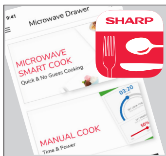
L'APPLICATION MOBILE SHARP KITCHEN vous donne un contrôle total.

Le tiroir à micro-ondes Sharp Sharp Microwave Drawer SMD2479KSC inclut une ventilation incorporée pour contrôler le flux d'air. Maintenant, il y a le choix d'une installation traditionnelle montée en surface ou une installation encastrée pour un look dépouillé, le tout sans besoin de moulures ni de déflecteurs additionnels. Le socle optionnel pour le SMD2479KSC se glisse dans la découpe d'un lave-vaisselle standard pour un aspect encastré sans avoir besoin d'un aménagement sur mesure.