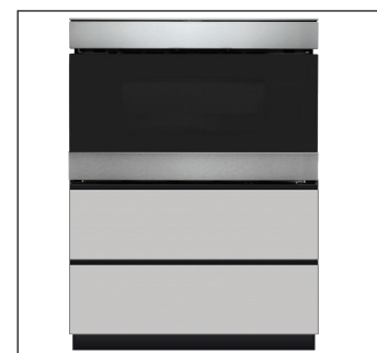
L'ACCESSOIRE SOCLE glisse sous le comptoir pour faciliter d'autant l'installation.

SHARP ÉLECTRONIQUE DU CANADA LTÉE 335, chemin Britannia Est, Suite 101, Mississauga, ON L4Z 1W9 Tel: 905-568-7140 www.sharp.ca Feb 2024 v2