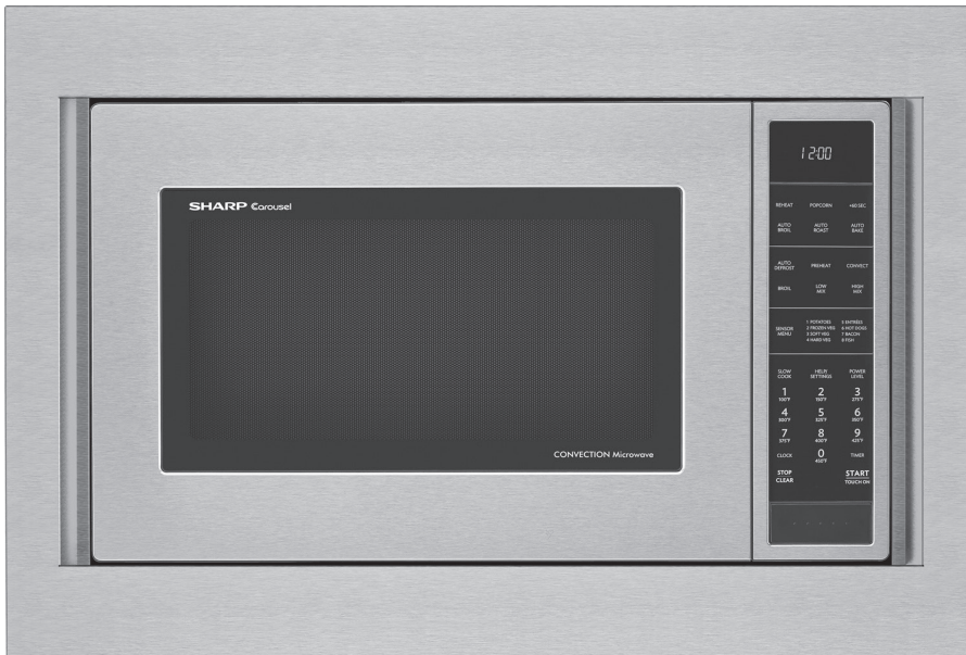
Four à micro-ondes avec convection SMC1585KS, et trousse d'encastrement RK94S30F

Le système de plaque tournante Carousel®, allié avec les fonctions innovatrices de Griller auto, Rôtir auto, Cuire auto, Dégivrer auto rend tout facile le réchauffage de vos aliments, casse-croûte et boissons favoris. Étant donné les décennies d'expérience de Sharp en matière de conception et fabrication de fours à micro-ondes intelligents et innovateurs, il est peu surprenant que ce soit la marque de choix des cuisiniers du monde entier.