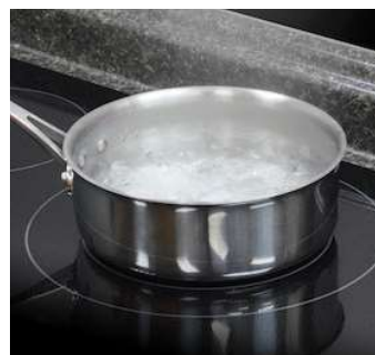
La fonction Simmer Enhancer maintient la température pour un mijotage extraordinairement constant.