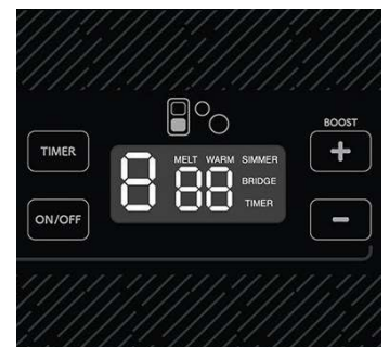
Les commandes DEL blanc vif rendent le verre tactile clair et facile à lire.