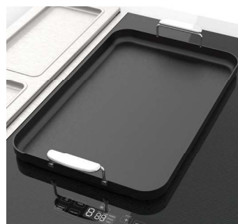
La SCH2443GB offre un élément-pont pour les poêles oblongues et les articles de cuisson plus longs.