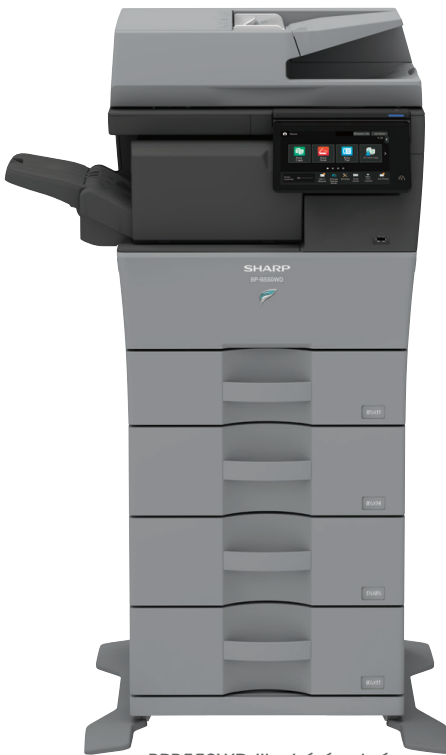
BPB550WD illustré équipé du finisseur interne, dans une configuration à 4 tiroirs.